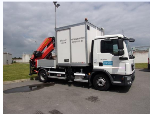
Achat d'un camion grue PL, avec une grue d'une capacité de levage d'1 Tonne à 8 m