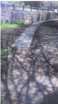
Réalisation des dalles situées le long de la berge du Bois-Joalland.

Travaux de renouvellement des tuyauteries/robinetteries sur divers postes de refoulement.