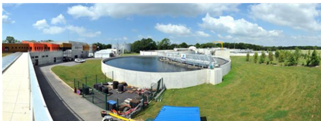
Zoom sur la STEP des Ecossiernes