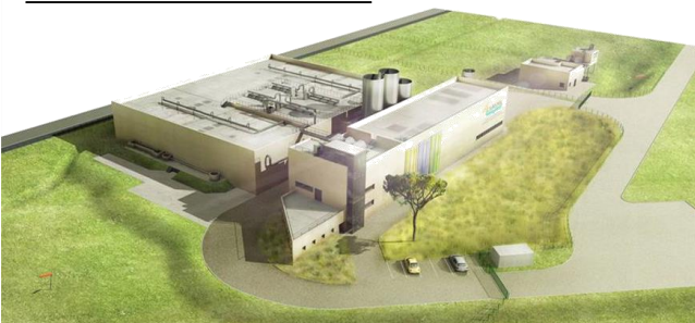
Zoom sur la STEP EST