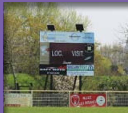
Le club de foot vient d'acquiescer un panneau de score. Installé par les services techniques, c'est la municipalité qui prend en charge sa maintenance.