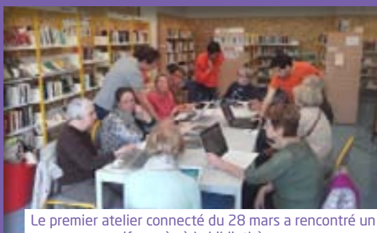
Le premier atelier connecté du 28 mars a rencontré un vif succès à la bibliothèque.