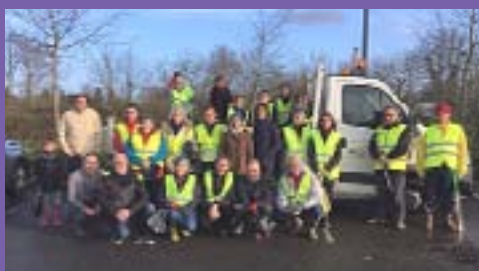
26 adultes et 6 enfants ont permis de ramasser une tonne de déchets lors de la marche écocitoyenne du 10 mars.