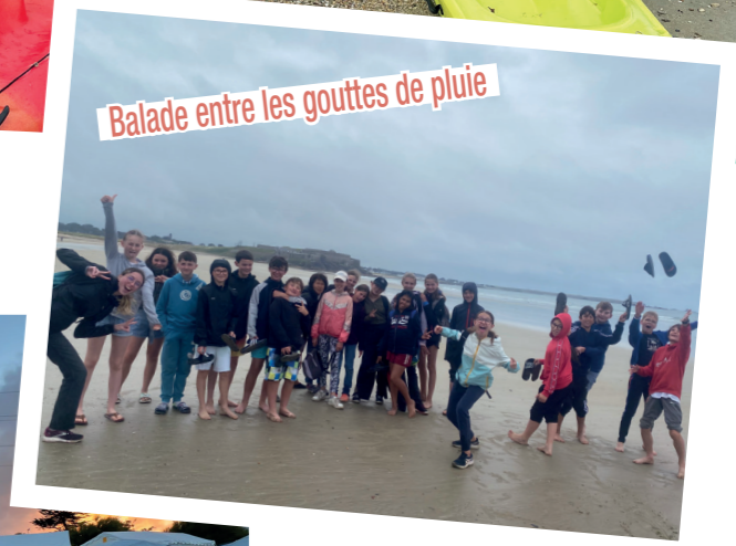
Balade entre les gouttes de pluie