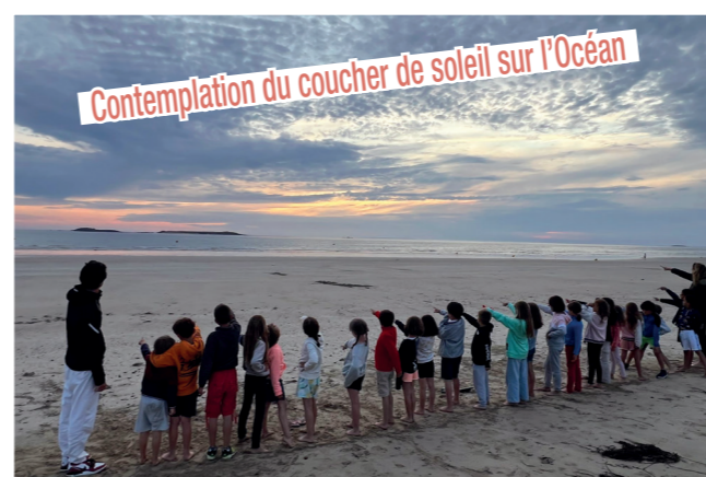
Contemplation du coucher de soleil sur l'Océan