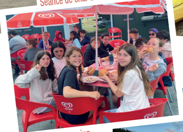
Au snack du camping