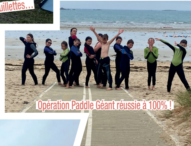
Opération Paddle Géant réussie à 100% !