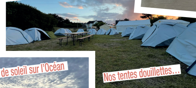
Nos tentes douillettes...