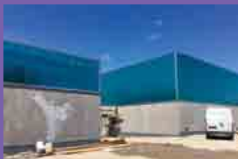
L'extension des salles sportives se poursuit.