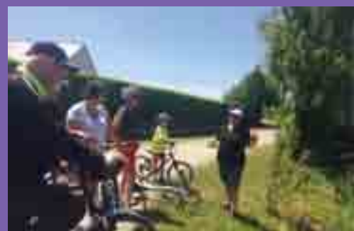
Lors de la semaine du développement durable, la Baladavel'eau, proposée le samedi 2 juin par le CPIE Loire-Océane, les quelques participants ont découvert les richesses de la faune et de la flore des marais.