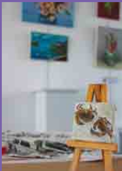
Les expositions artistiques se sont tenues salle du Parvis jusqu'au 24 juin.