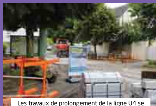
Les travaux de prolongement de la ligne U4 se dérouleront tout le mois de juillet.